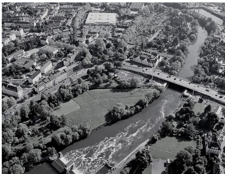
Hafenbrücke während des Umbaues 2010