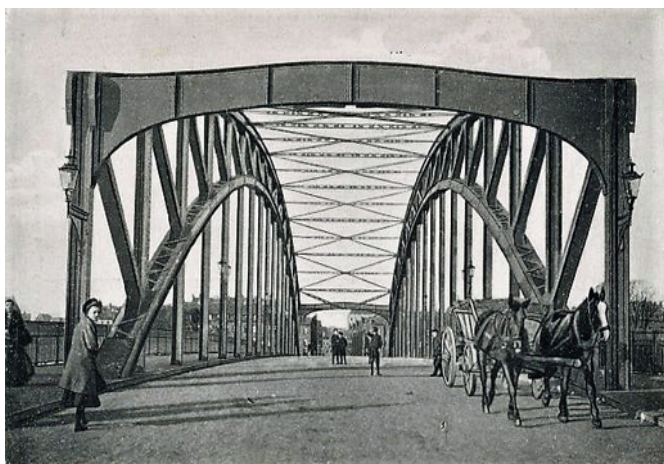
Hafenbrücke kurz nach Ihrer Einweihung 1908