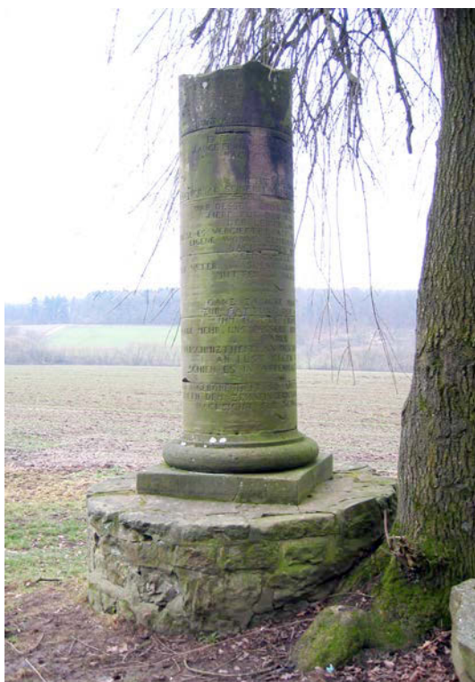
Affendenkmal im Landschaftspark Windhausen

Nach dem Verlassen des Landschaftsgartens kommen wir auf eine Hochfläche, die einen weiten Ausblick auf den Kaufunger Wald, den Kaufunger Stiftswald, die Söhre, Kaufungen und Kassel bietet. Nach dem Überqueren der Kreisstraße passieren wir das rechts liegende Gebiet der ehemaligen Burg Sensenstein. Oberhalb von Dahlheim haben wir einen sehr guten Ausblick in das obere Niestetal. Wir treten wieder in das Waldgebiet des Mühlenberges ein und wandern durch den Wald bis zum nach unten in das Tal führenden Abzweig nach Uschlag. Von hier aus wandern wir am Fuß des Mühlenberges entlang der im natürlichen Bachbett uns begleitenden Nieste. Nach einem kurzen Wegstück entlang der Landesstraße und einer letzten Steigung auf einem landwirtschaftlichen Weg erreichen wir bald den Endpunkt der Wanderung, die Bushaltestelle Wichernstraße in Heiligenrode. Da hier die Busse sonntags nur alle zwei Stunden nach Kassel fahren, müssen wir je nach Ankunftszeit noch etwa 600 Meter weiter laufen, um einen der sonntags stündlich nach Kassel fahrenden Busse zu erreichen.